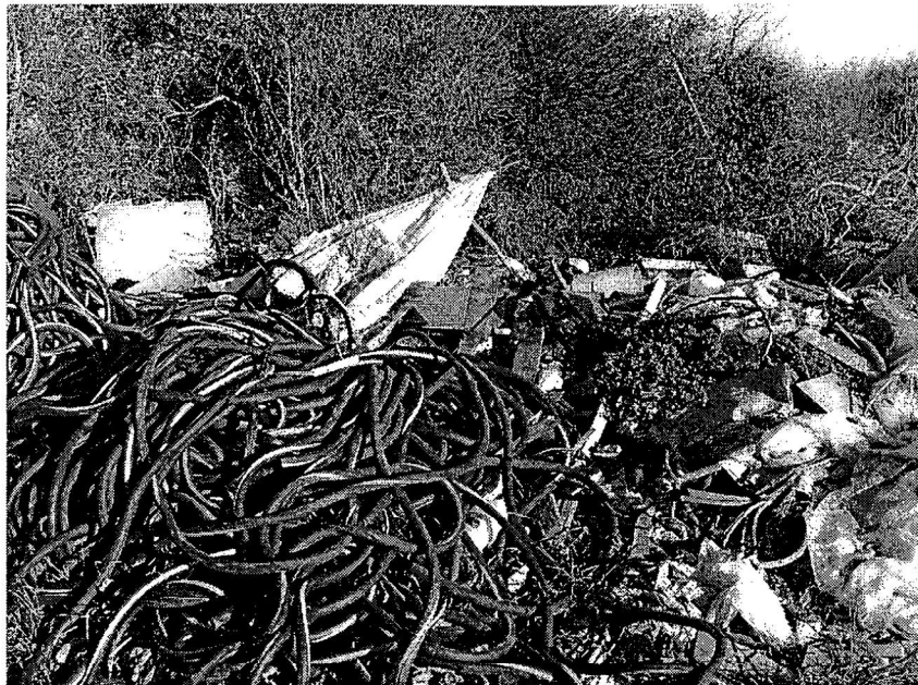
Na području općine Ližnjan ( u blizini naselja Jadreški) nalazi se i Romsko naselje gdje je smješteno sakupljalište otpada ( opasnog i neopasnog)