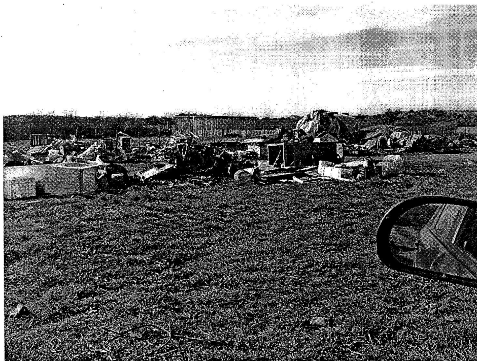
Na području Općine Ližnjan postoji još cijeli niz manjih divljih odlagališta.